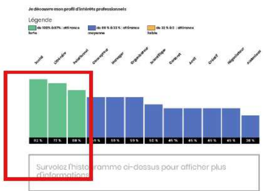
Figure 3 : Exemple de résultat au questionnaire d'intérêt en ligne.